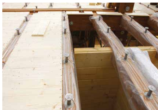
Nuova soletta con sistema H.S.B.