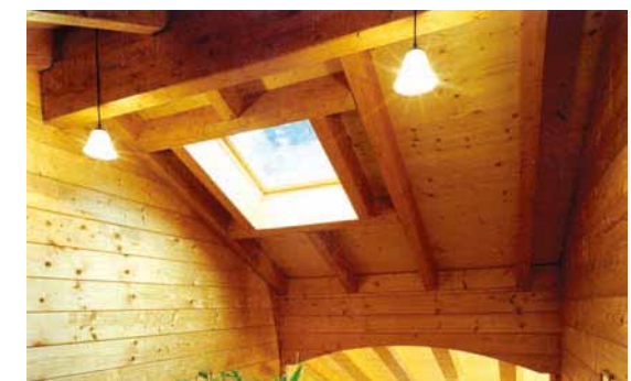
Esempio di realizzazione e finiture

Habitat Legno mette a disposizione il proprio Ufficio Tecnico per dimensionamenti non contemplati in tabella e per applicazioni speciali (recupero solai esistenti), declinando ogni responsabilità nel caso non intervenga direttamente nella progettazione e/o posa in opera.