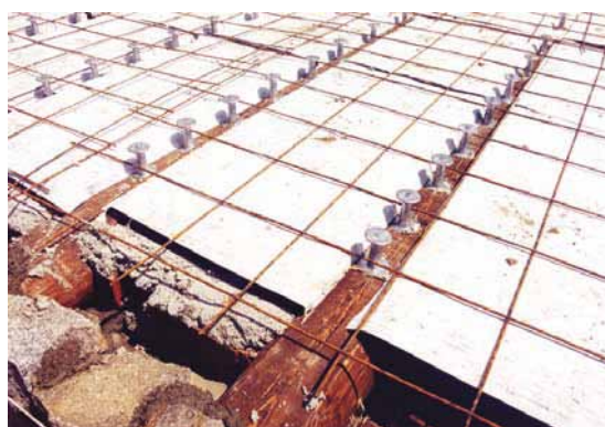
Recupero soletta con inserimento sistema H.S.B. su travi esistenti