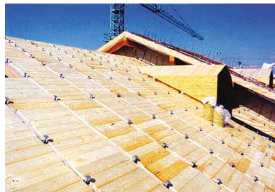
Realizzazione nuovo solaio con interposto in perlinato.

A stagionatura avvenuta si provvederà a rimuovere il sostegno centrale e a togliere l'involucro di protezione dei travetti tagliando il film polietilenico a filo dell'appoggio dell'interposto e ripulire eventuali colature del getto stesso.